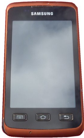
Skærmen på Samsung Xcover ser stadig ud som ny efter godt et halvt års brug